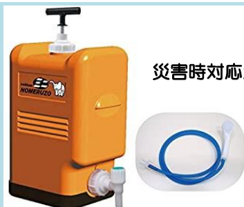
災害時対応浄水器