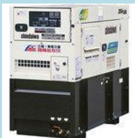
エアコン・照明設備に同時対応できる発電機 (町内自治会では唯一の設備)