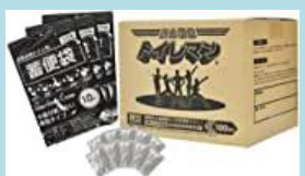
非常時対応トイレ用品